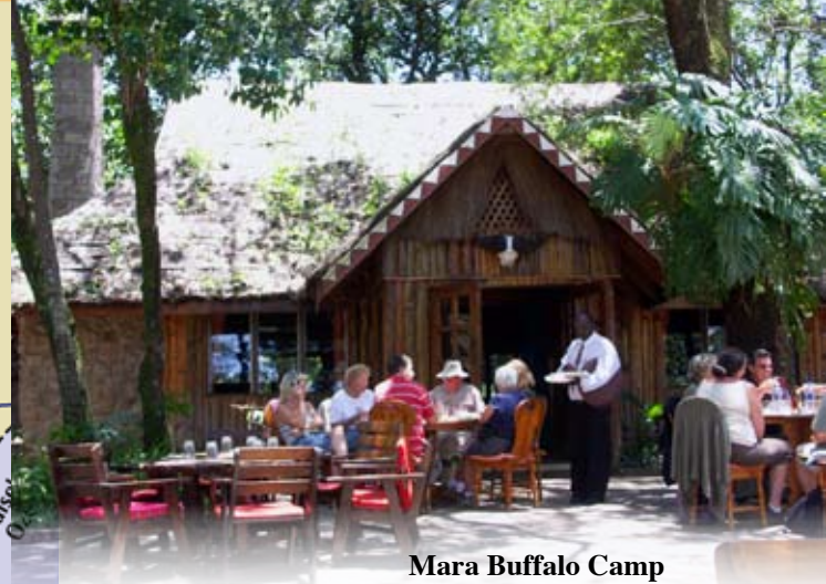
Mara Buffalo Camp