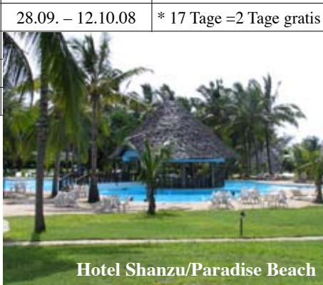
Hotel Shanzu/Paradise Beach

Frühbuchbonus: Club Class (p.P. € 200,-) Royal Class (p.P. € 500,-) zum 1/2-Preis bei Buchung bis 31.12.07